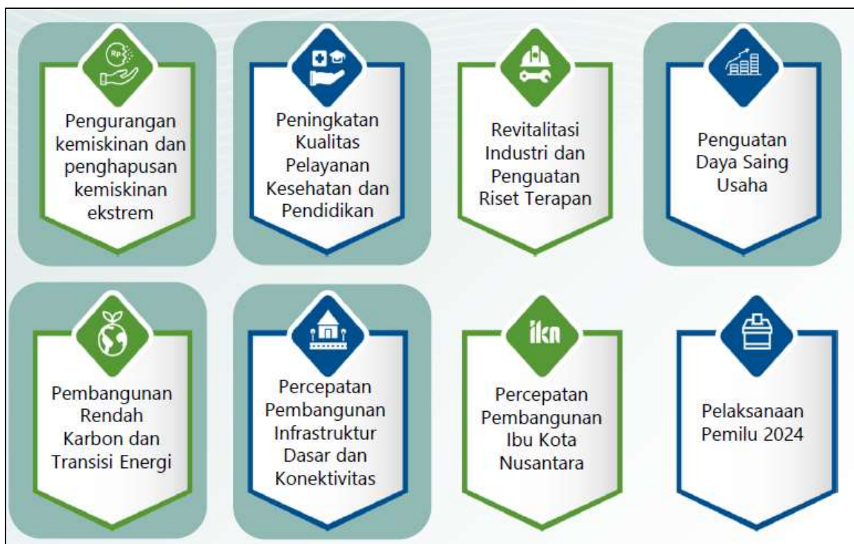
Gambar 3.1 Arah Kebijakan RKP Tahun 2024

Pada Tahun 2024, Tema Pembangunan Nasional yang ditetapkan dalam RKP Tahun 2024 adalah "Mempercepat Transformasi Ekonomi yang Inklusif dan Berkelanjutan" dengan 8 arah kebijakan sebagai berikut: